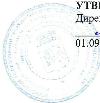
ГРАФИК работы столовой МАОУ «НОШ № 1»