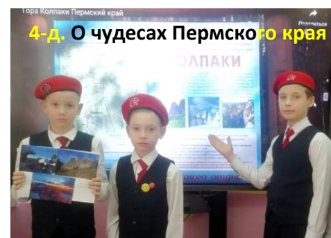
4-д. О чудесах Пермского края