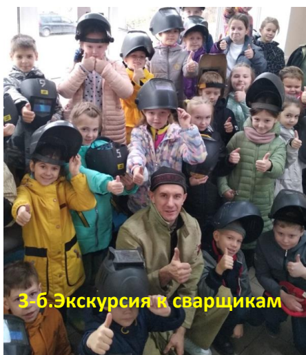
3-б. Экскурсия к сварщикам