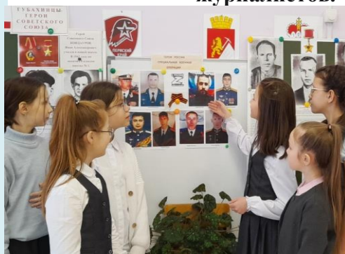
Юнкоры ведут экскурсии. 4 «в» класс.