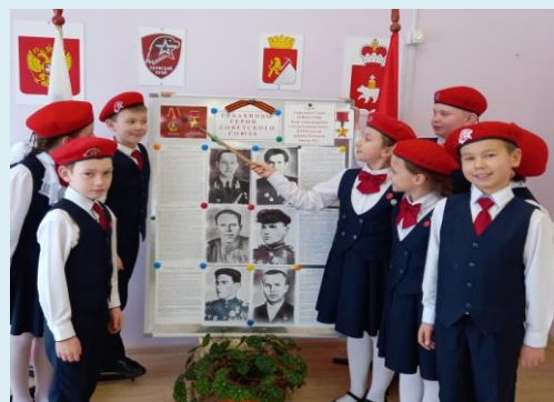
Юнкоры ведут экскурсии. 4 «д» класс.