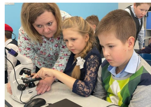
Поездка в тенториум в Чусовой.. Знакомство с микроскопом.