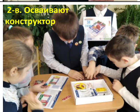
2-в. Осваивают конструктор