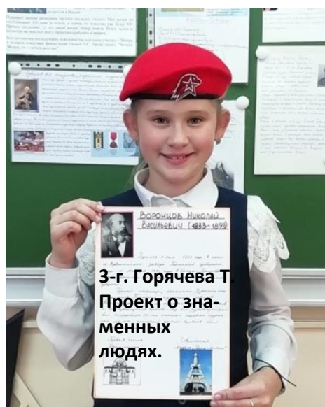
3-г. Горячева Т Проект о зна- менных людях.