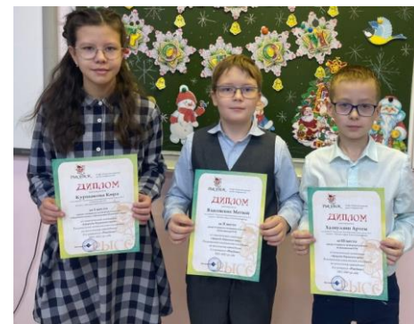
Победители олимпиады «Рысёнок»