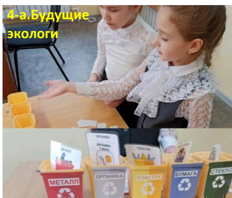
4-а. Будущие экологи