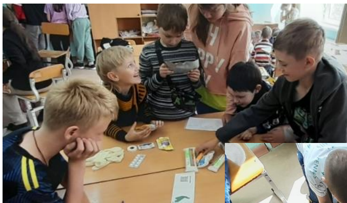
Собирают автомобильную аптечку для оказания первой помощи