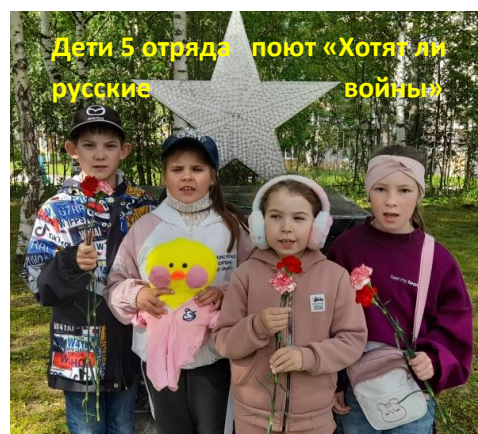
Дети 5 отряда поют «Хотя бы русские войны»