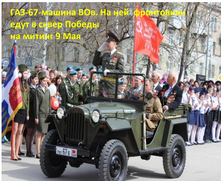
ГАЗ-67-машина ВОВ. На ней фронтовики едут в сквер Победы на митинг 9 Мая

Юнкоры провели опрос среди учеников школы – чем они гордятся в родном городе. Вот что узнали: