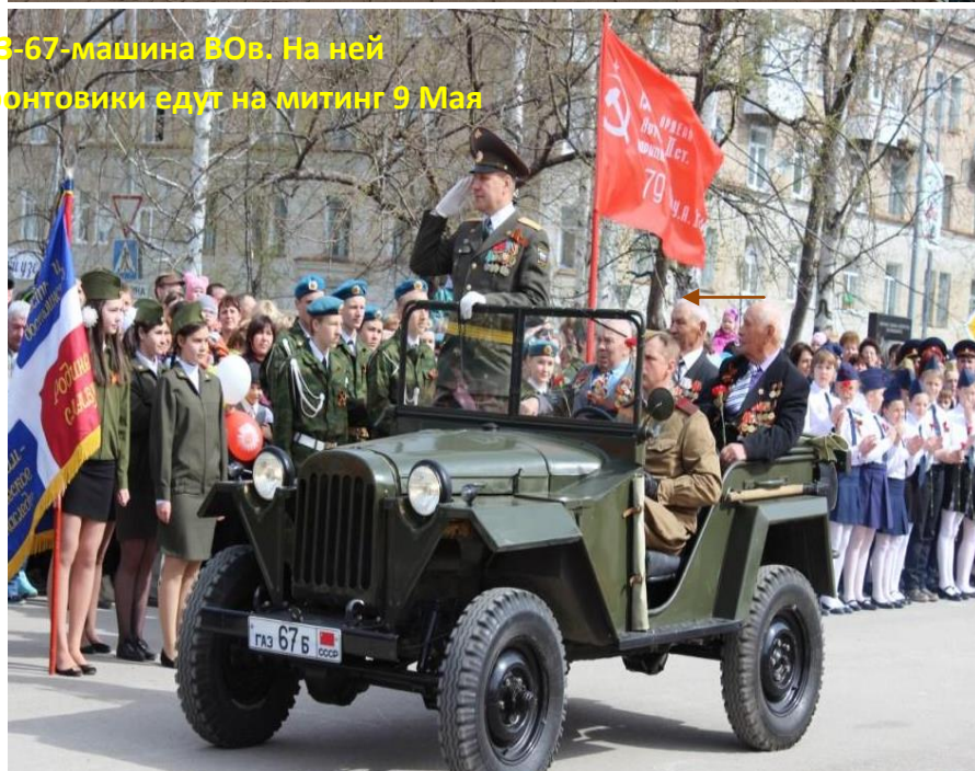
ГАЗ-67-машина ВОВ. На ней фронтовики едут на митинг 9 Мая