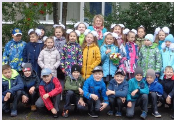
Коллектив 4 «б» класса.

Мы все чрезвычайно рады, что пришёл День Знаний. Школа вновь гостеприимно встречает своих учеников, хоть и в специфических условиях.