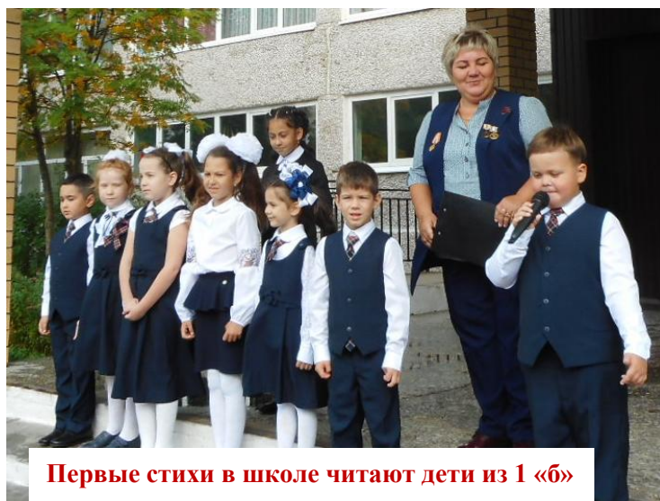
Первые стихи в школе читают дети из 1 «б»